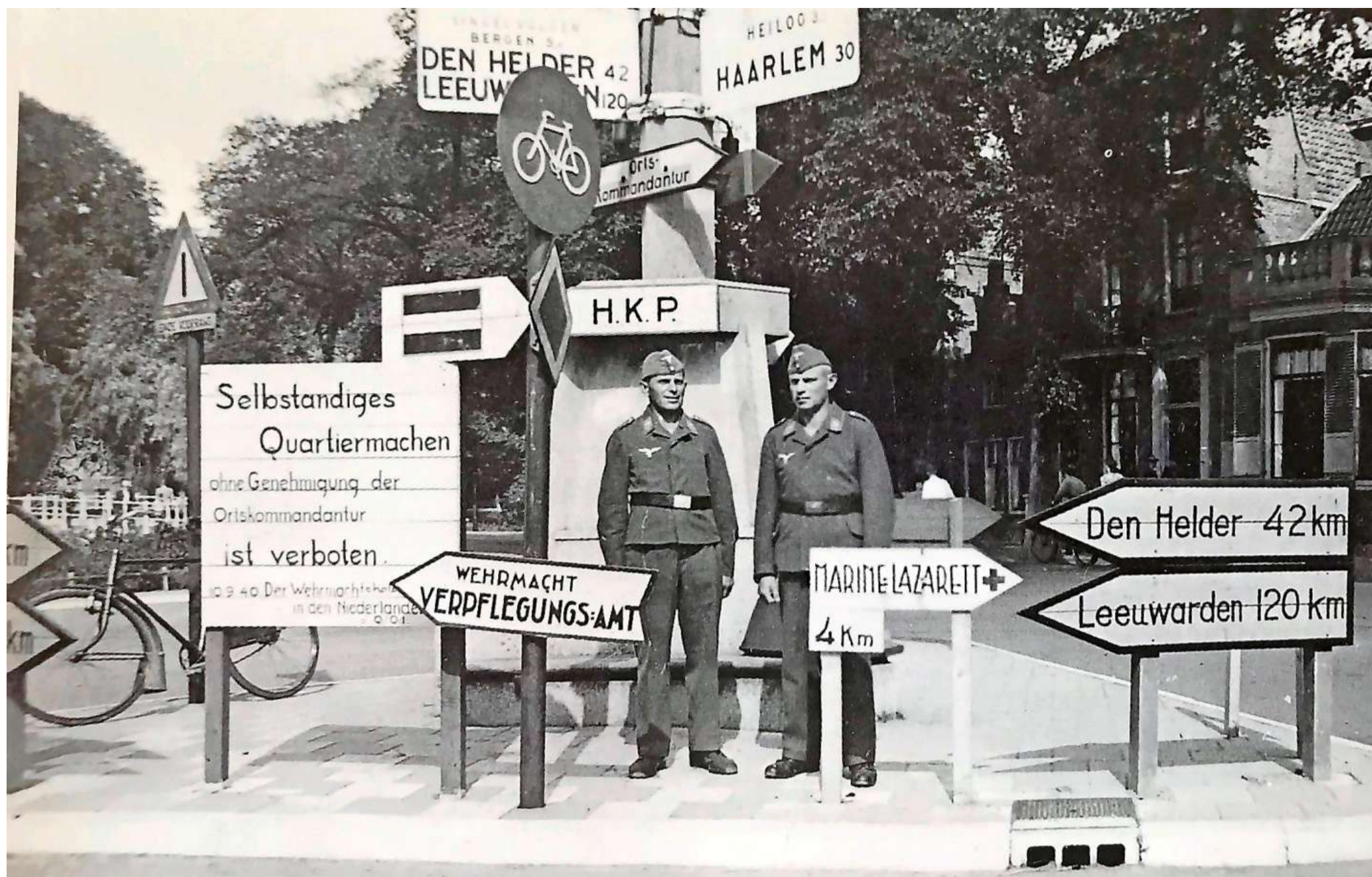
'Marine Lazarett 4km' staat op een van de vele richtingaanwijzers nabij de Alkmaarse Molen van Piet, met daarachter twee Duitse soldaten.