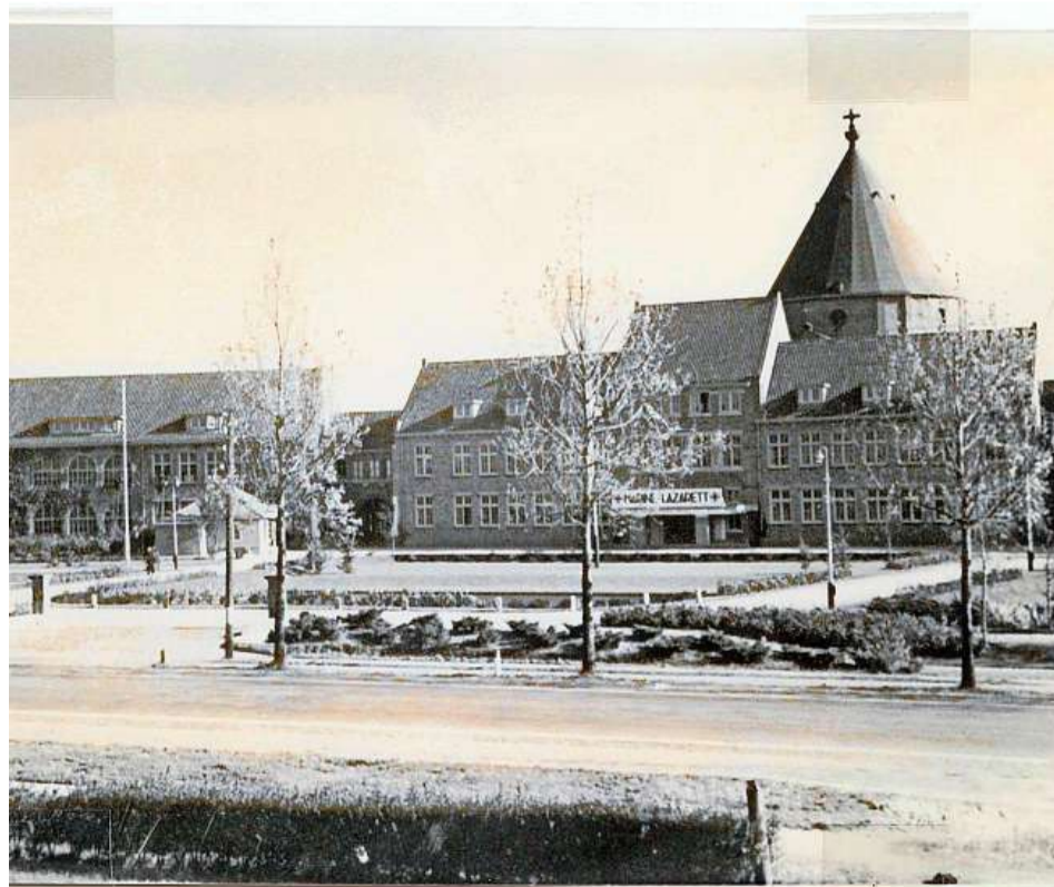
De St. Willibrordusstichting als Marine Lazarett in de oorlogsjaren. De Duitsers hingen later op het dak van de koepel nog een doek met een groot rood kruis erop.

Ook voor een Duits marinehospitaal was gewoon personeel nodig, zo blijkt uit deze vacature.