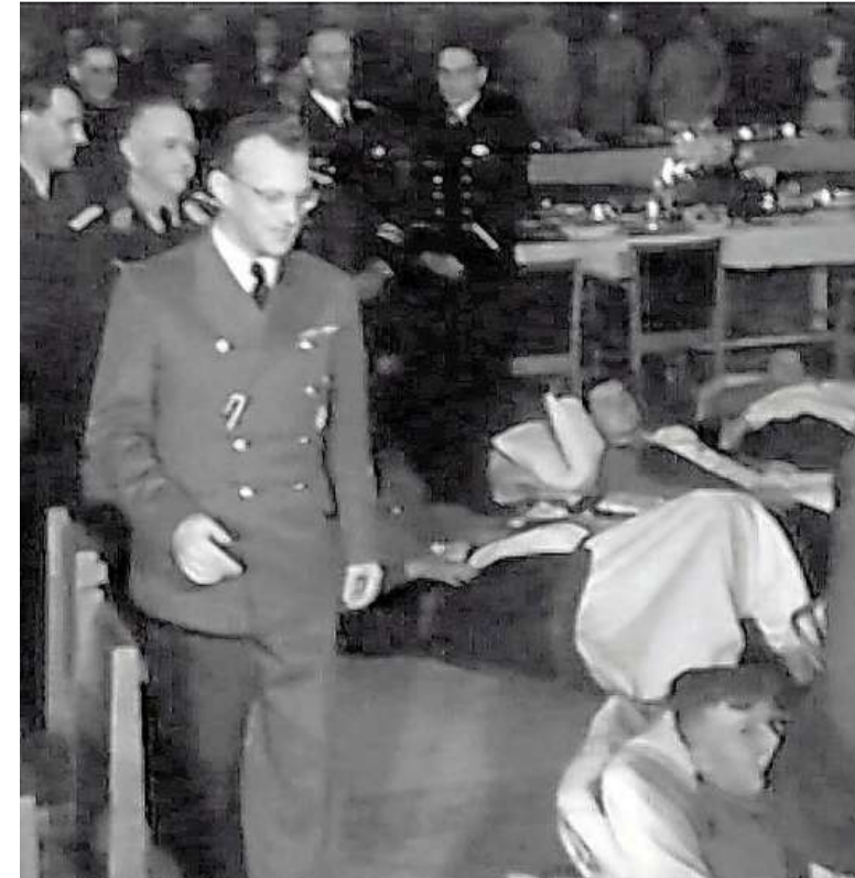
Arthur Seyss Inquart komt de feestzaal binnen voor het kerstdiner van 1940.